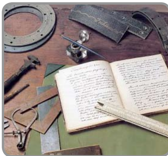
Delar ur det ursprungliga produkt- och verktygsprogrammet

Den egna produktionen av friktionsmaterial utvecklades redan under 1940-talet och programmet har i välplanerade steg istället byggts på med nya, noggrant utvalda produkter.