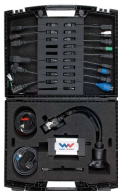
Interface, 7-pol kabel m.m.

En robust väska med tre lager innehåller all hårdvara som behövs