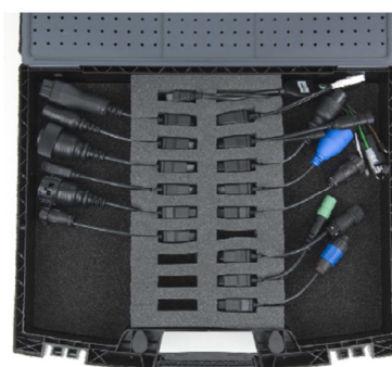
Fordonsunika kablar för universaldiagnos