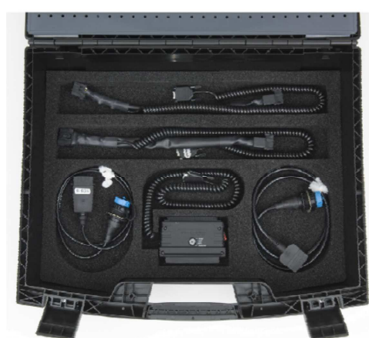
WABCO SD Diagnos